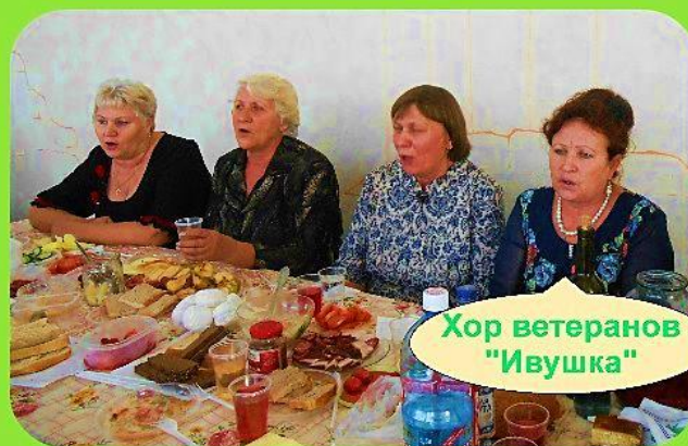
Хор ветеранов "Ивушка"