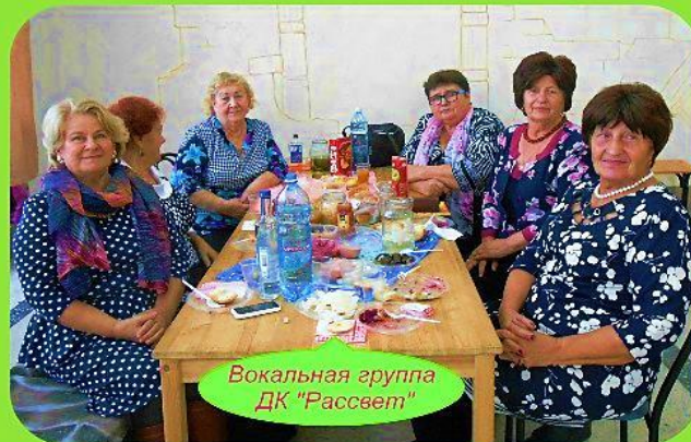
Вокальная группа ДК "Рассвет"