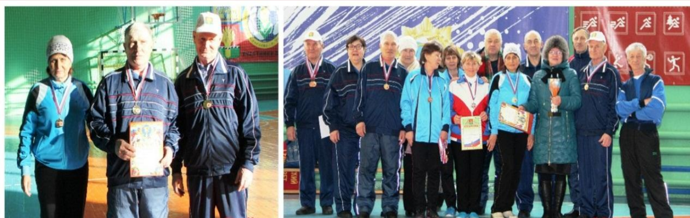
Районная седьмая зимняя спартакиада, 2016 г.

4 февраля 2016 года по результатам соревнований седьмой зимней спартакиады, команда ветеранов рабочего поселка Коченево заняла первое общекомандное место. Призеры в личном зачете были награждены медалями и грамотами. Команда-победитель получила кубок и грамоту Главы Коченевского района.